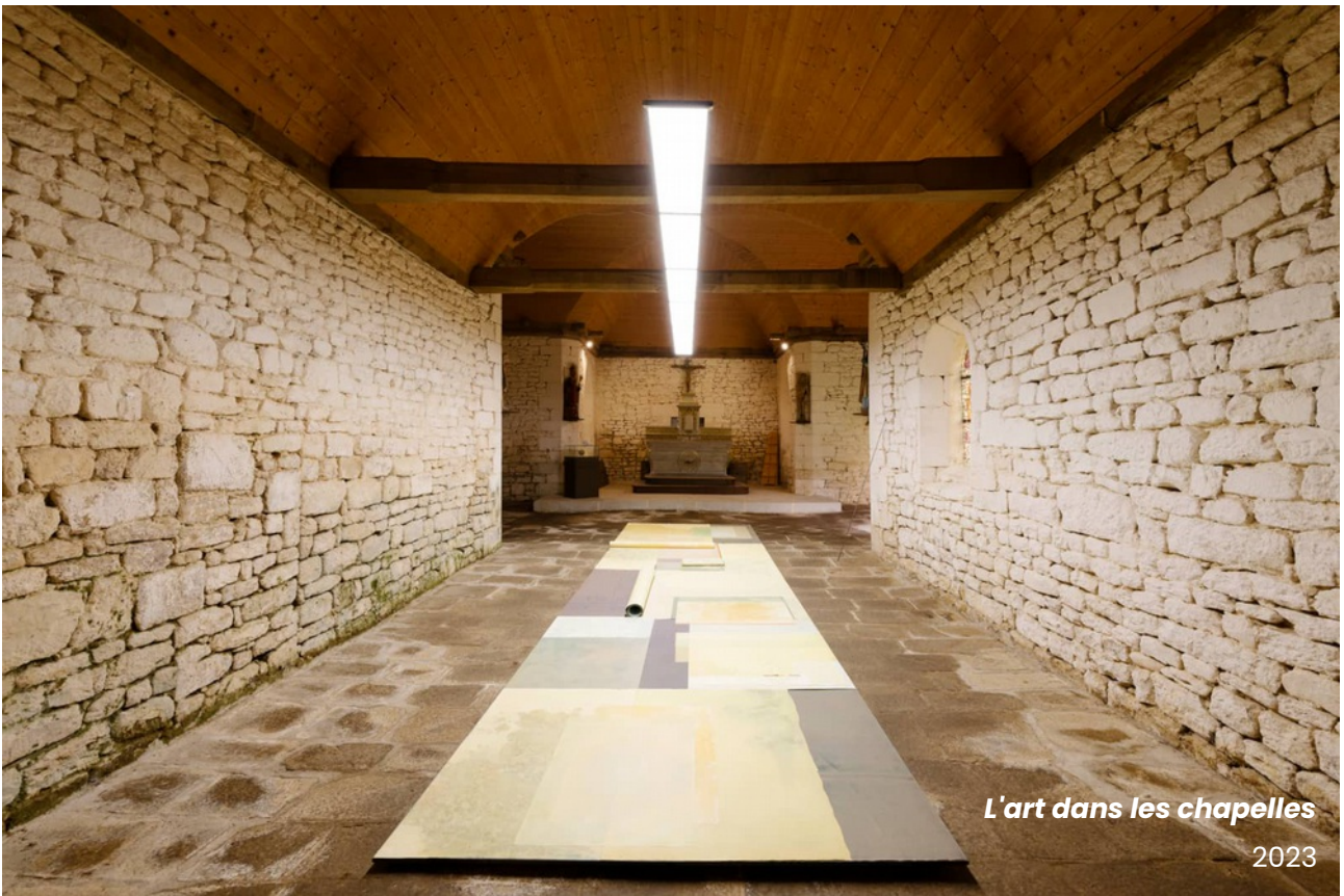
L'art dans les chapelles 2023